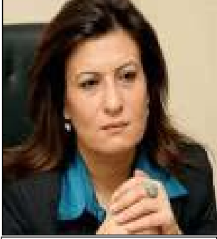
Millî Eğitim Bakanı Nimet CUBUKÇU

“Eğitim alanında yapılan her türlü yeniliğe açığız. Vakıf üniversitelerinin kurulmasını da destekliyoruz. Bu okullar rekabet ve kalite getirdi. Eğitimin bir alternatifi değil bir parçası olarak görüyoruz. Çünkü eğitime yapılan yatırım, ülkeye ve geleceğe yapılan yatırımdır. Bakanlık olarak kurumlarımızı destekliyoruz.” diyen ülkemizin ilk kadın Millî Eğitim Bakanı Sn. Nimet Çubukçu'nun eğitimin ötündeki engelleri kaldıracağına