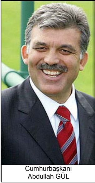
Cumhurbaşkanı Abdullah GÜL

Bugün uygulanmakta olan rektör seçim veya atama sisteminden kamuoyu gibi, karar ve onay makamı olan Cumhurbaşkanı'nın da rahatsız olduđu bu nedenle, yeni bir sistemin bulunmasını arzu etmiş olduđu açıklanmıştır. Köřkte bir yılını dolduran Abdullah Gül, NTV televizyon programında, rektör seçimleri için sorulan bir soruyu şöyle yanıtlamıştı: