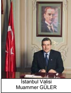
İstanbul Valisi Muammer GÜLER