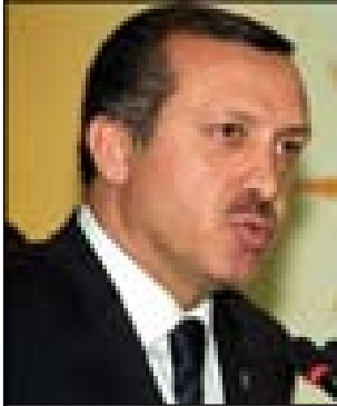
Başbakan Recep Tayyip ERDOĞAN

Öğrencilere yetkili ve etkili bir makam tarafından doğru bilgi verilmesi gerektiğine acil ihtiyaç var. Gençlerimiz bugünkü eğitim sisteminden memnun iseler ve başka istemleri yoksa onlara diyecek bir sözümüz yok. Eğer dünya ile yarışmayı göze alacaklarsa, dünyanın her yerinde geçerli olan bir meslek edinmeyi, kısaca aranan bir kişiliğe sahip olmak istiyorlarsa, onlara söyleyecek sözümüz var: “Ülkemizin AB düzeyinde bir refaha kavuşması sizin erinç ve gönencinizin yerinde olmasına bağlıdır. Bu da en azından AB ülkeleri düzeyinde bir eğitim almanızla kazanılır.”