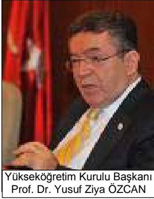
Yükseköğretim Kurulu Başkanı Prof. Dr. Yusuf Ziya ÖZCAN

geçirmeyi düşünüyordu. Tanıdığı ve bildiği kişiye üniversiteyi teslim edeceğini hayal ediyordu. Rektör seçimlerinde üç aday içinden, aldıkları oylara bakılmaksızın dilediğini rektör tayin etme yetkisini kullanabilmek için bu demokratik olmayan ve özerklikle bağdaşmayan sistemi getirmişlerdi.